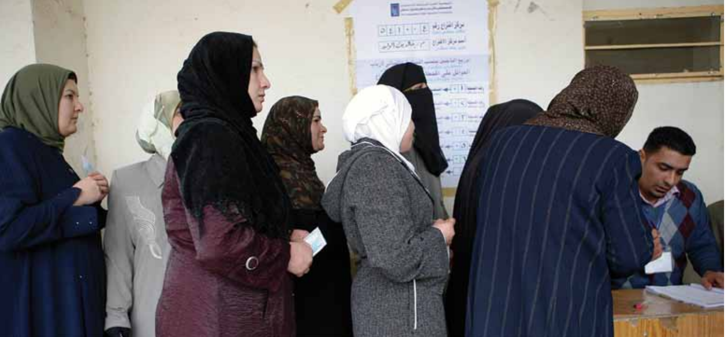
Des électrices irakiennes en file d'attente devant dans un bureau de vote.

le Dialogue international sur la consolidation de la paix et le renforcement de l'État : New Deal pour l'engagement dans les États fragiles 7 identifient cinq priorités stratégiques dans les situations d'après-conflit. Ces domaines prioritaires se recoupent largement. D'autres documents de réflexion ou des notes d'orientation du Recueil d'informations d'ONU Femmes