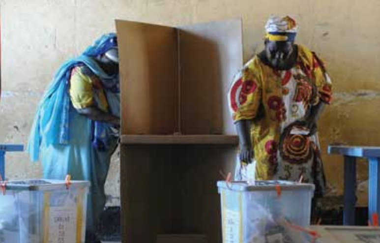
Des femmes de Juba, au Soudan, votent aux élections présidentielles de leur pays, les premières à être organisées depuis près de 25 ans. Initialement fixé du 11 au 13 avril, le vote a été prolongé de deux jours.

La raison n'en était pas seulement d'éviter les intimidations, mais aussi de contrer les pressions exercées pour suivre les habitudes de vote de la famille. S'assurer que les observateurs électoraux nationaux, régionaux et internationaux comprennent que le vote familial est illégal, et qu'ils peuvent l'identifier et le documenter devrait être un volet essentiel de la formation des observateurs électoraux. Ces derniers devraient par ailleurs avoir des listes permettant de comprendre les disparités de genre pouvant apparaître au cours d'une élection. L'OSCE a rédigé un manuel détaillé sur la surveillance de la participation des femmes aux élections, comportant une liste de contrôle à l'intention des observateurs électoraux 17 . Cette liste peut être facilement adaptée à différents contextes.