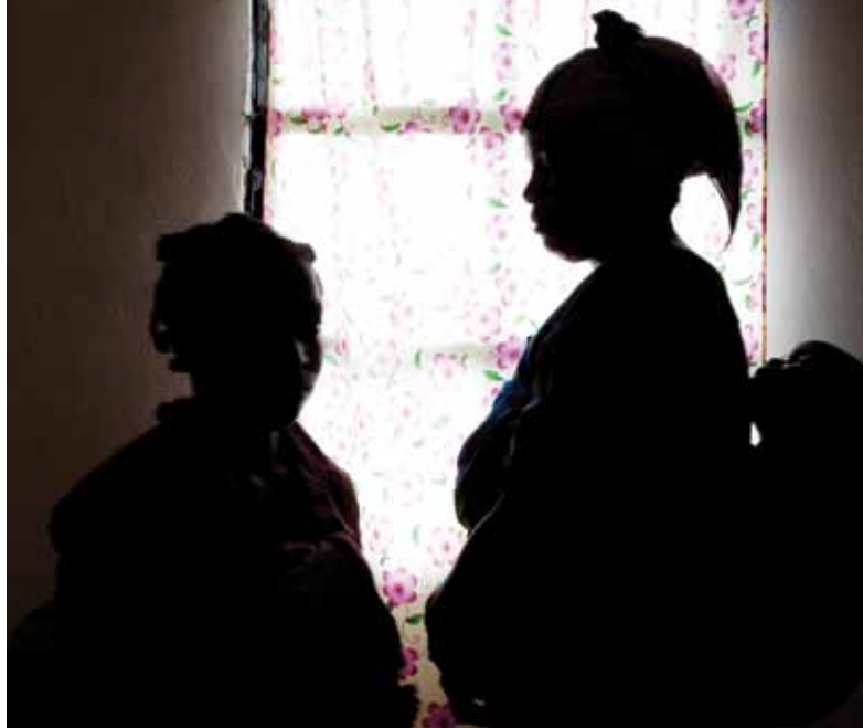
Foyer d'accueil pour femmes victimes d'abus sexuel à Goma.

Au Népal, un « programme de mesures provisoires » permanent a été créé pour répondre aux besoins matériels spécifiques des familles de personnes tuées, disparues ou blessées, et indemniser ceux qui ont subi une perte ou des dommages de leurs biens pendant le conflit d'une dizaine d'années qui a sévi dans ce pays. Ce programme de secours assure l'indemnisation des familles de personnes tuées ou disparues, le remboursement des frais médicaux pour les blessés et prend en charge les dépenses d'éducation des enfants de moins de 18 ans de personnes tuées ou disparues, dans la limite de trois enfants. Toutefois, ce programme n'est pas lié à un processus officiel de recherche de la vérité, ni à des enquêtes ou des poursuites judiciaires organisées par le gouvernement portant sur les violations ayant entraîné les préjudices mêmes pour lesquels le programme d'aide est mis en œuvre. Le gouvernement népalais indique qu'un programme de réparation complet sera mis en place si et lorsqu'une commission Vérité et une commission distincte sur les disparitions seront mises en place. La dissociation des programmes d'aide de la responsabilité a pour conséquence la persistance de l'impunité dont jouissent les responsables des violations perpétrées. Une autre de ses conséquences est le sentiment général parmi