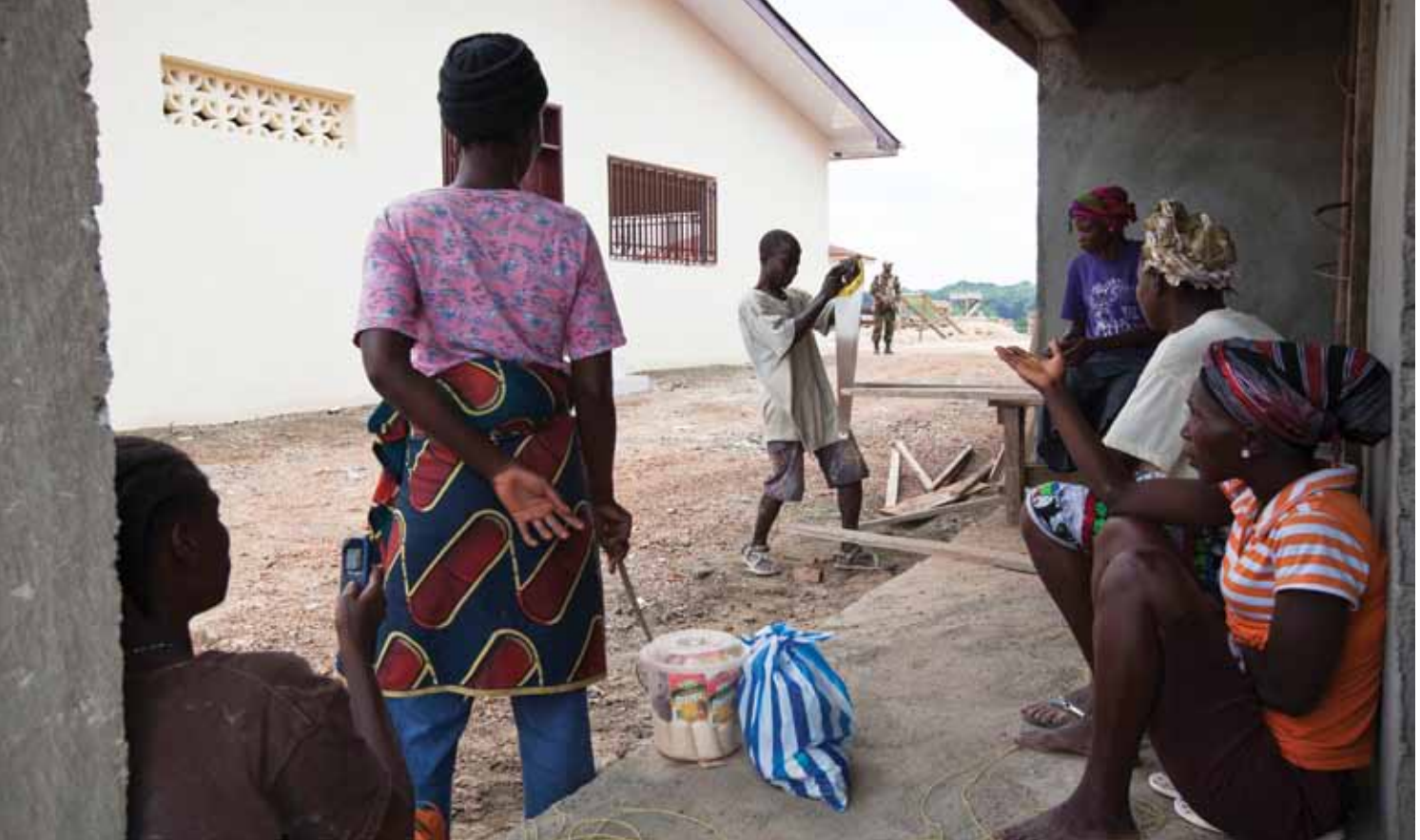
Construction d'un centre pour la paix et la justice à Gbarnga au Libéria. Cette nouvelle initiative est financée par le Fonds des Nations Unies pour la consolidation de la paix.