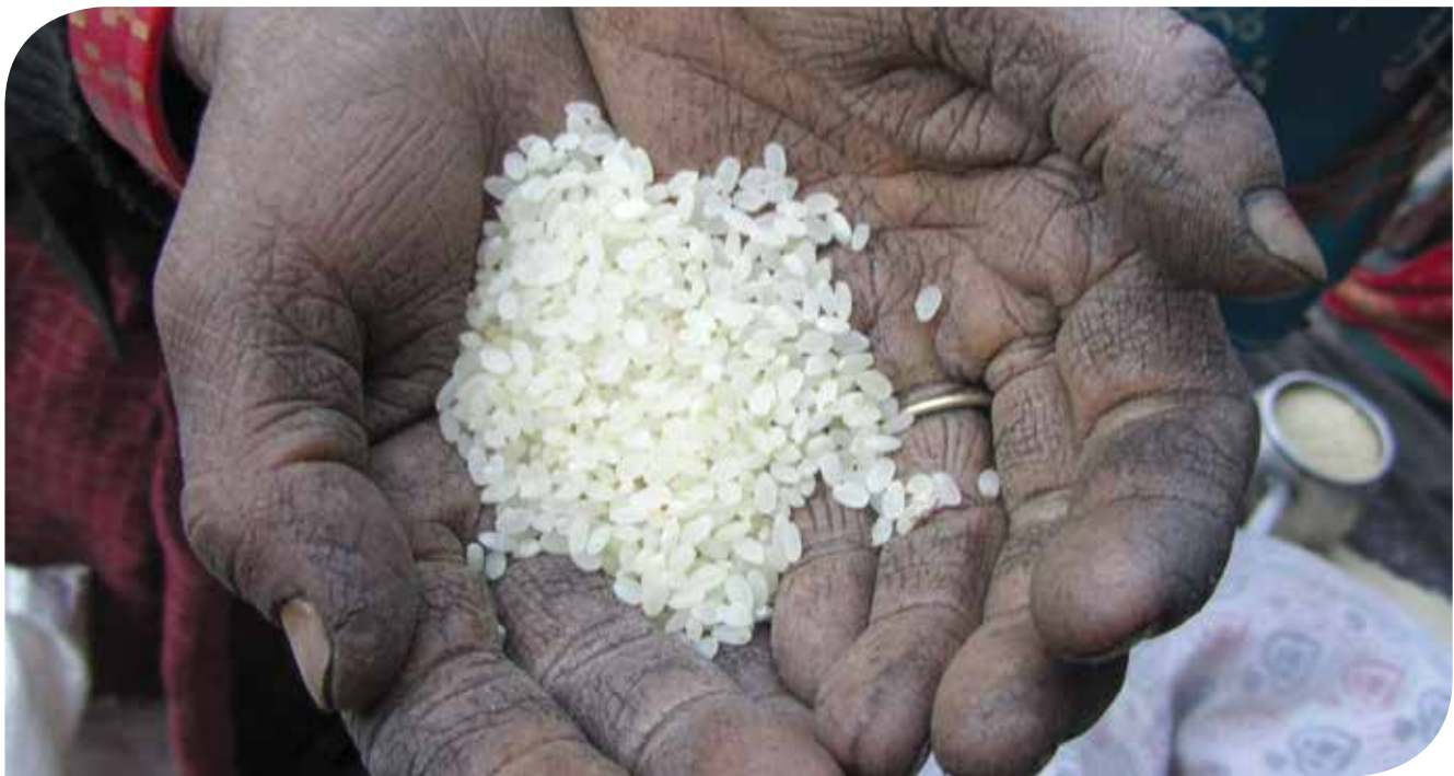
Femme rurale montrant du riz offert par le Gouvernement japonais au Gouvernement népalais et distribué par la Nepal Food Corporation (NFC) à Gamgadi, district de Mugu, Népal