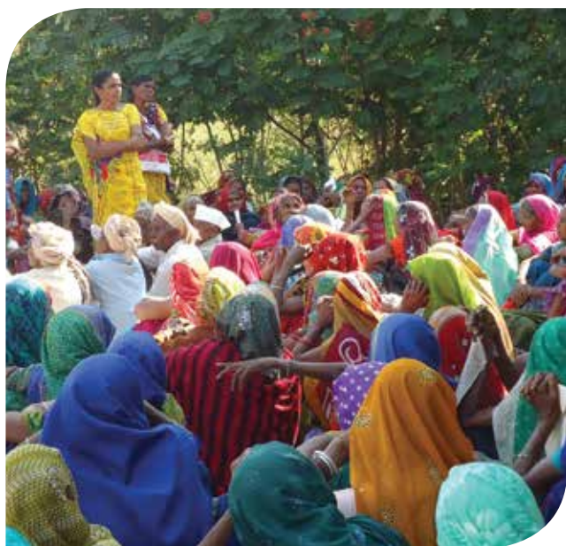
Audience publique et manifestation pour le droit à l'alimentation au Gujarat, 2014

« Avoir le droit en tant que femmes à une carte de rationnement ne nous permet pas seulement d'obtenir des céréales ; c'est aussi une reconnaissance de notre contribution au sein de la famille, de la communauté et de l'Etat. Nous sommes désormais entendues. »